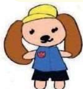
三大のさんちゃん